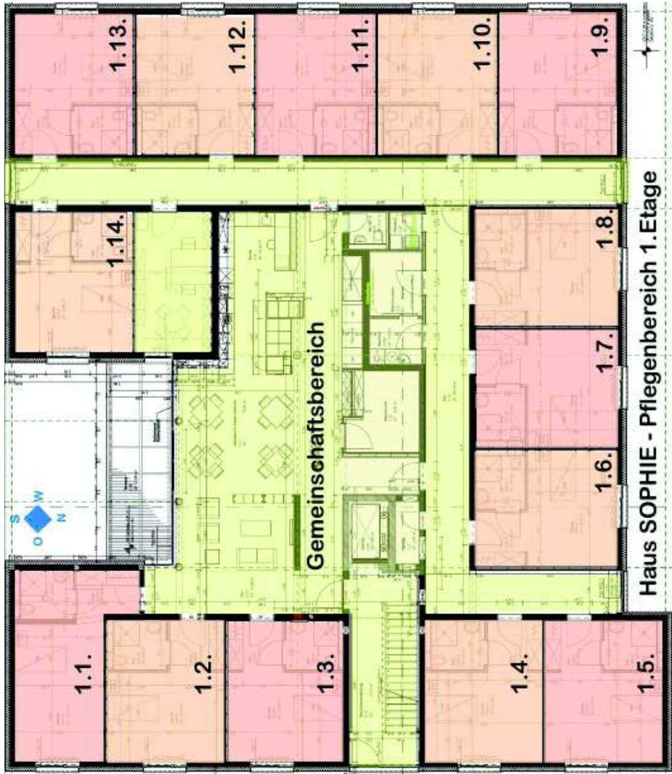
Haus SOPHIE - Pflegenbereich 1.Etage